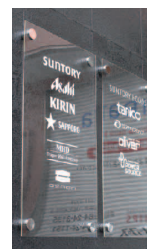
アクリルボード看板 (浮かせ取付)

新規オープンだけでなく、繁盛店を目指す飲食店様は大歓迎いたします。どうぞお気軽にお越しいただき、ご活用ください。