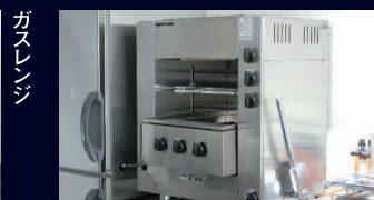
ガス赤外線両面グリラー