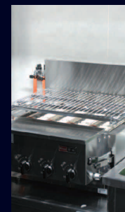
ガス赤外線グリラー (下火式焼物器)