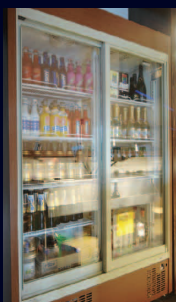
冷蔵ショーケース