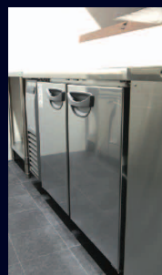
コールドテーブル