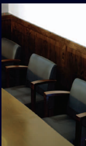
1Fカウンターチェア

1Fフロアは実店舗スペース。 本格的カウンターに厨房機器、ドリンク、フードなど、営業に必要な素材が揃っています。 2Fフロアでは落ち着いた環境で商談や打合せなどを行うことができます。